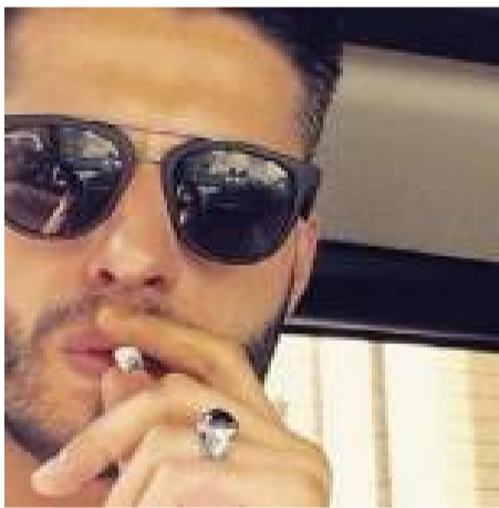
Perquisizione a casa Schiavone, indagati due figli di Sandokan