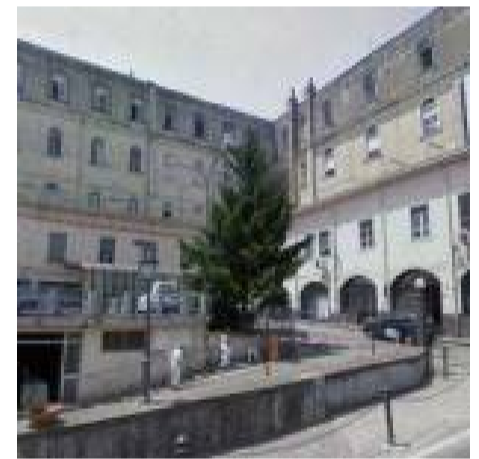
Lite con spari al Pronto soccorso di Cava de' Tirreni, due feriti