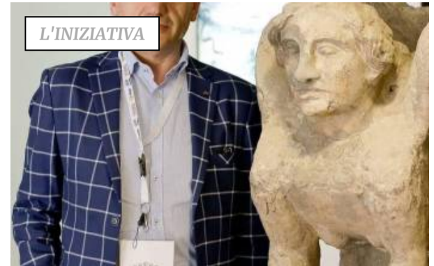
Vesuvius Campania Felix: pubblico e privato in rete per promuovere turismo e cultura

Se vuoi commentare questo articolo accedi o registrati