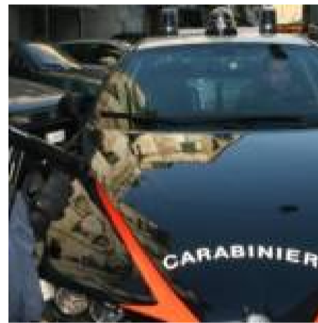
Clan Casalesi, 17 arresti tra ras e "figli d'arte"