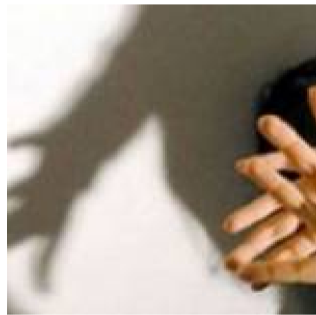
Pugni e schiaffi ai suoi alunni, divieto di dimora per educatore